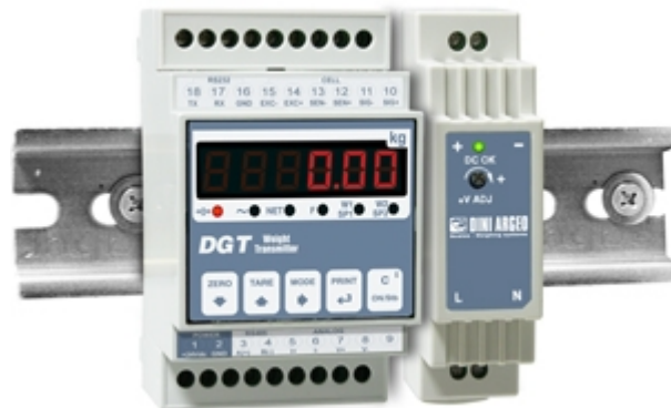
DGT1 mit optionalem Netzteil DR1512 für C-Schiene (DIN).